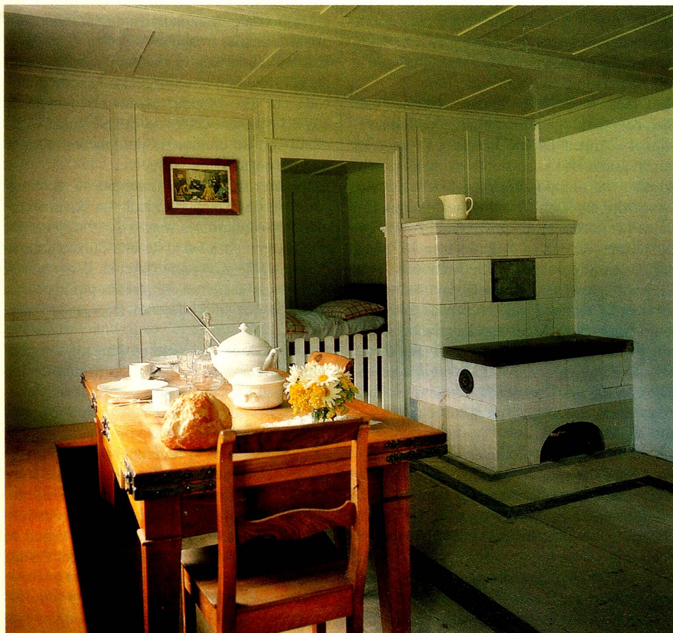
Los muebles rústicos auténticos son hoy una rareza. El Museo al aire libre de Ballenberg se enorgullece de su rica colección de muebles rústicos restaurados.

Este ejemplo ilustra un capítulo de la historia suiza. Lo mismo se puede decir de otros muchos objetos de exposición, cuya variada expresión es imposible resumir aquí. Este museo tan vivo se esfuerza en presentar los