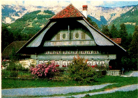
Casa multifuncional de Ostermundigen (Ber-na) 1797. Casa de labranza acomodada, construida por el teniente capitán Bendicht Gosteli.

tradicionales trabajos de artesanía que tenían lugar en las casas. Por esa razón en Ballenberg se cuece el pan en el horno de leña, se teje y se talla la madera o el cestero nos muestra su habilidad. En este lugar también se cuida la flora nativa. El jardín de hierbas constituye un tesoro particular, símbolo de la medicina tradicional.