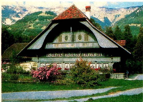
Casa multifuncional de Ostermundigen (Berna) 1797. Casa de labranza acomodada, construida por el teniente capitán Bendicht Gosteli. (Fotos: a la disposición)

tradicionales trabajos de artesanía que tenían lugar en las casas. Por esa razón en Ballenberg se cuece el pan en el horno de leña, se teje y se talla la madera o el cesterero nos muestra su habilidad. En este lugar también se cuida la flora nativa. El jardín de hierbas constituye un tesoro particular, símbolo de la medicina tradicional.