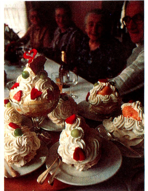
Postre clásico del Emmental

ejemplo el monumento a Tell en Altdorf, pero, al mirar más detenidamente, se nota que la atmósfera patriótica está sensiblemente perturbada por la presencia irrespetuosa, en primer plano, de alguien que esquite carozos de cerezas. La siguiente «combinación» es todavía más provocativa: un joven soldado en traje de