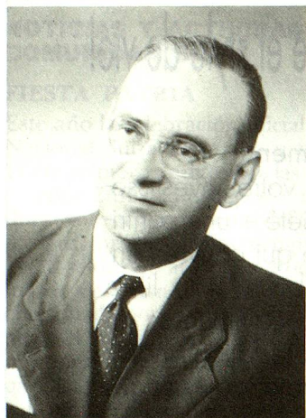
Carl Lutz.

En 1944, Carl Lutz, que entonces era Vicecónsul de Suiza y jefe de la División de la Protección en Budapest, logró salvar la vida de muchos miles de judíos húngaros gracias a un método genial. El próximo mes de diciembre será inaugurado en el centro de la capital húngara un monumento de bronce en su honor.