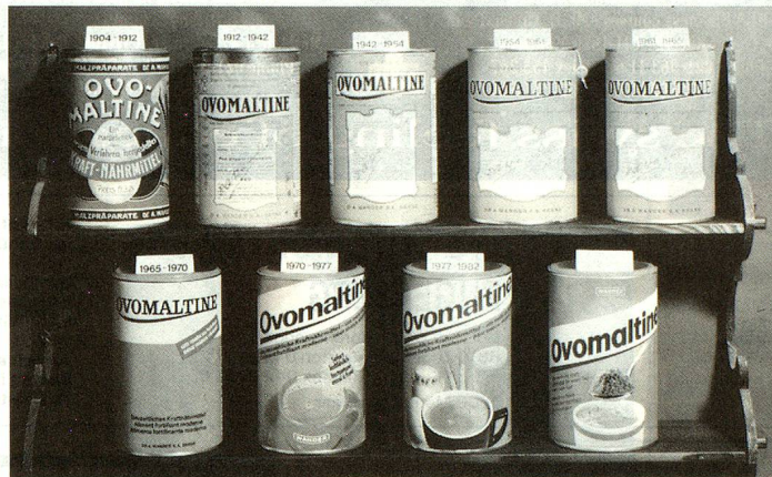
Envases de Ovomaltina de antes y de ahora. (Foto de archivo).

Para mucha gente, Wander, a justo título, es sinónimo de Ovomaltina. Este producto, compuesto de malta de cebada, leche, huevos, levadura y un poco de cacao (sin azúcar ni sustancias fibrosas) fue una de las primeras creaciones de Wander y triunfó en el mundo entero. Pero la Ovomaltina no nació simplemente de la idea genial de un día, sino que fue el fruto de muchos años de investigación y estudio de nuevos métodos. No obstante esta empresa, que en sus principios no ocupaba nada más que a dos per-