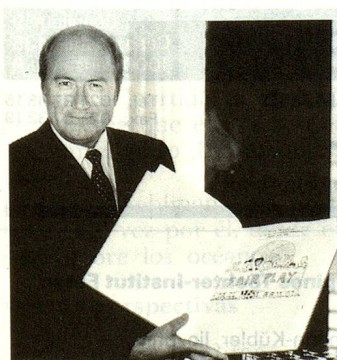
Joseph Blatter.

de las mujeres en la Iglesia Católica. Por otra parte, su nombramiento como Obispo Coadjutor en 1988 había sido ya vivamente discutido.