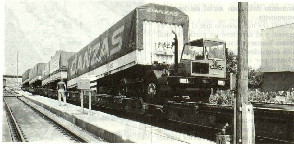
El tránsito de camiones pesados en la mira de las críticas: el traslado del transporte de mercaderías al ferrocarril está reivindicado por el tráfico en tránsito.

Esto significa ante todo que el crecimiento del tránsito debe tener ciertos límites, que el desarrollo de los medios de transporte debe ser efectuado en forma coordinada, que las repercusiones negativas del tránsito deben ser reducidas, que el tráfico internacional, particularmente el tráfico en tránsito, debe ser llevado a cabo en forma rentable, preservando de manera óptima el medio ambiente con una economía máxima de energía y de