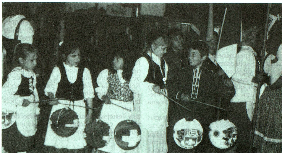
Niños ataviados con trajes típicos en el desfile de banderas y lampiones.