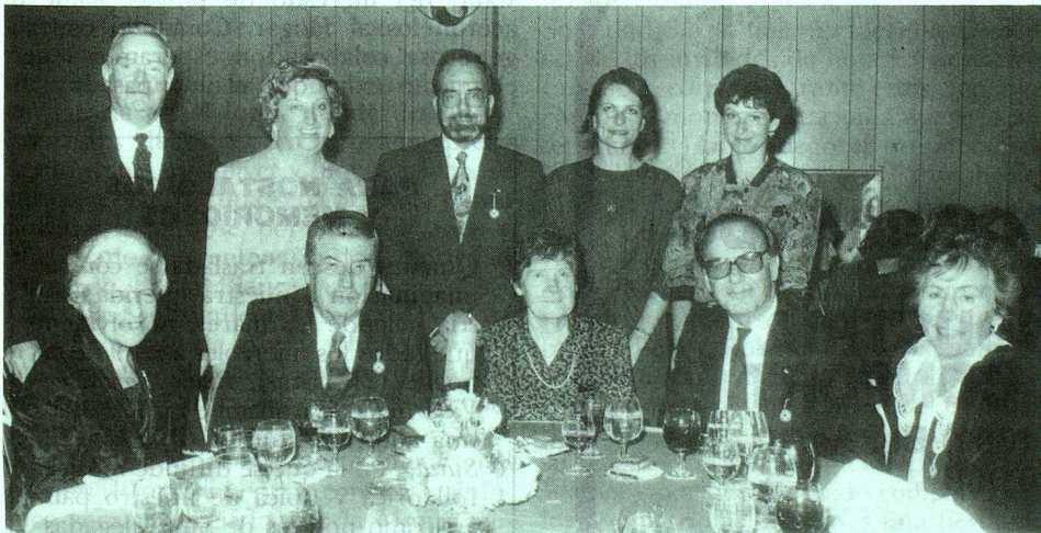
La mesa oficial presidida por el Señor Embajador