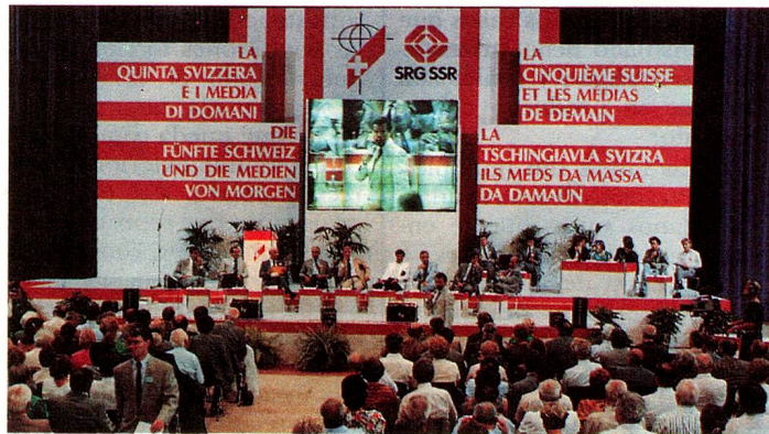
Un congreso consagrado a los medios masivos de comunicación en un decorado de estudio de televisión.

las necesidades de los suizos del extranjero. No obstante, esas buenas intenciones tropiezan actualmente con ciertas limitaciones de orden técnico, y muchos suizos del extranjero no lo saben muy bien. El especialista de los PTT destacó que la recepción