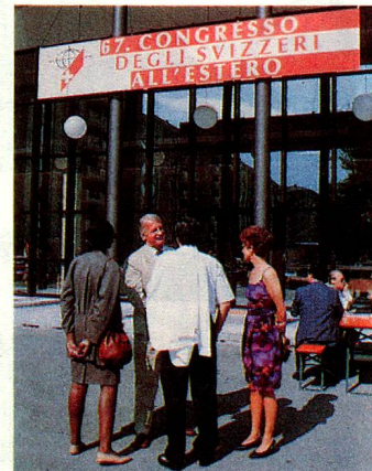
Lugar de encuentro: El Congreso de los Suizos del Extranjero