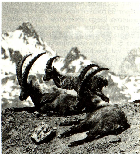
Las cabras monteses puestas en libertad en 1930 forman actualmente una gran colonia.

mas de protección del medio ambiente, el siglo XIX puede aparecer como idílico, pero es una imagen engañosa. Hace cien años, la naturaleza perdía poco a poco terreno: frente a la industrialización y al crecimiento demográfico. Ya en 1870, una iniciativa privada, justamente ésta, permitía la creación de la primera reserva natural, al pie del Creux du Van, en el Jura de Neuchâtel. A principios de este siglo, se hizo sentir la necesidad de poner bajo protección total una superficie suficientemente extensa de nuestro país y, en 1914, la Asamblea Federal aprobó el decreto federal relativo al Parque Nacional Suizo en la Baja Engadina. Situada en una región alejada de los Alpes, en la frontera con Italia, esta reserva muestra verdaderamente la naturaleza en estado puro. Es un paisaje austero, con montañas en dolomita brillante y valles salpicados de guijarros. En 1904, en esta región agreste, en el Piz Pisoc, fue abatido sobre territorio suizo el último oso. Desde entonces aquí se aplica la regla: ni hacha ni disparos de armas de fuego.