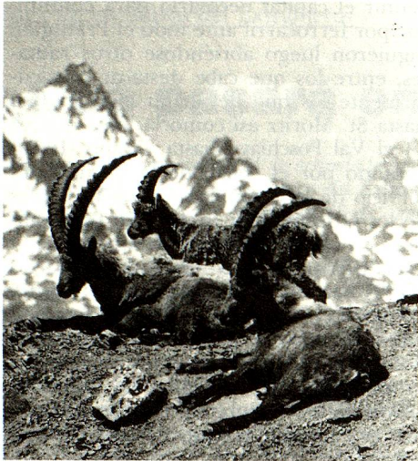
Las cabras monteses puestas en libertad en 1930 forman actualmente una gran colonia.

mas de protección del medio ambiente, el siglo XIX puede aparecer como idílico, pero es una imagen engañosa. Hace cien años, la naturaleza perdía poco a poco terreno: frente a la industrialización y al crecimiento demográfico. Ya en 1870, una iniciativa privada, justamente ésta, permitía la creación de la primera reserva natural, al pie del Creux du Van, en el Jura de Neuchatel. A principios de este siglo, se hizo sentir la necesidad de poner bajo protección total una superficie suficientemente extensa de nuestro país y, en 1914, la Asamblea Federal aprobó el decreto federal relativo al Parque Nacional Suizo en la Baja Engadina. Situada en una región alejada de los Alpes, en la frontera con Italia, esta reserva muestra verdaderamente la naturaleza en estado puro. Es un paisaje austero, con montañas en dolomita brillante y valles salpicados de guijarros. En 1904, en esta región agreste, en el Piz Pisoc, fue abatido sobre territorio suizo el último oso. Desde entonces aquí se aplica la regla: ni hacha ni disparos de armas de fuego.