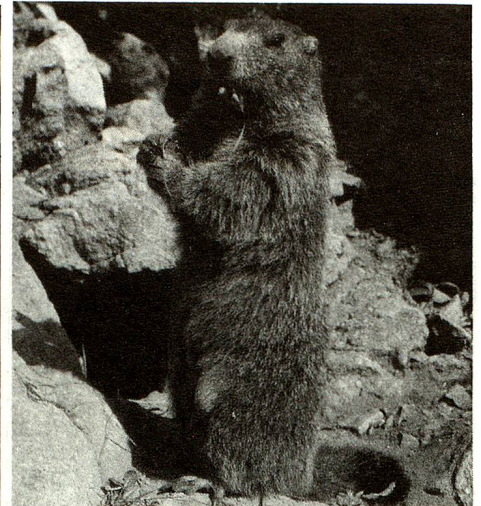
Aunque están severamente protegidas, las marmotas no se multiplicaron desmesuradamente en el Parque Nacional. La responsable es el águila real.

Ya en 1909, por iniciativa de amigos de la naturaleza, la parte central del Parque Nacional fue puesta bajo protección. Muy pronto se agregaron otras zonas, para las que las comunas de Zernez, de S-chanf y de Valchava habían hecho arrendamientos a largo plazo. La Confederación retomó el todo el 1º de agosto de 1914. El Parque Nacional que, gracias a ulteriores extensiones alcanza actualmente una superficie de 169 kilómetros cuadrados, es el más antiguo de Europa Central. «Particularmente hoy día, cuando tanto nos preocupamos de nues-