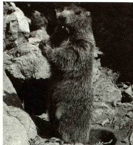
Aunque están severamente protegidas, las marmotas no se multiplicaron desmesuradamente en el Parque Nacional. La responsable es el águila real.

Ya en 1909, por iniciativa de amigos de la naturaleza, la parte central del Parque Nacional fue puesta bajo protección. Muy pronto se agregaron otras zonas, para las que las comunas de Zerne, de S-chanf y de Valchava habían hecho arrendamientos a largo plazo. La Confederación retomó el todo el 1º de agosto de 1914. El Parque Nacional que, gracias a ulteriores extensiones alcanza actualmente una superficie de 169 kilómetros cuadrados, es el más antiguo de Europa Central. «Particularmente hoy día, cuando tanto nos preocupamos de nues-