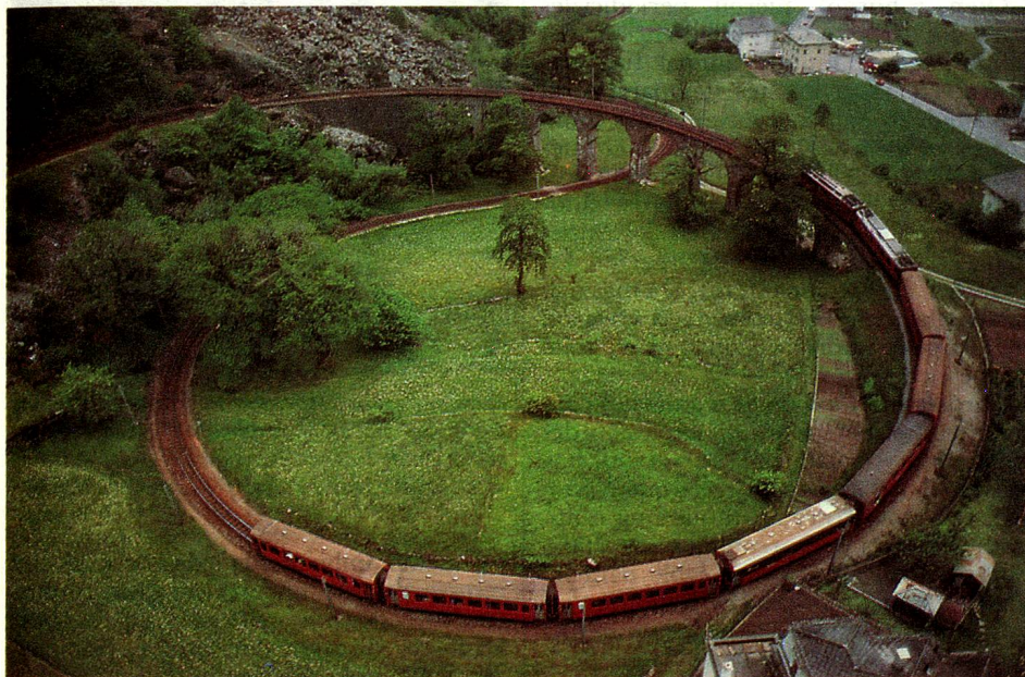
Viaducto en forma de círculo para franquear la rampa situada cerca de Brusio, en el Val Poschiavo.

El 9 de octubre de 1889, el convoy inaugural atravesaba el Prättigau sobre la línea Landquart-Davos, la primera de los ferrocarriles de los Grisones, que hoy llevan el nombre de «Ferrocarriles Réticos» (RhB). Actualmente es la compañía privada cuya red es la más extendida en Suiza (375 km.). Hace 100 años, la ciu-