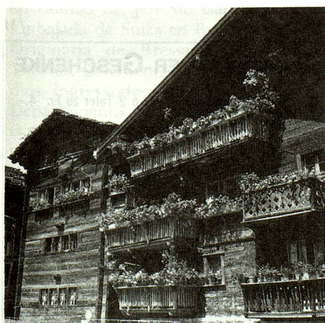
Evolene en el valle de Hérens (Valais).

Desde el siglo XIX, la belleza de los lugares, la calidad del recibimiento han atraído turistas a Evolene, región conocida como una de las más destacadas de la civilización artística de los Alpes. Hasta 1939, los «visitantes» de vacaciones nunca alteraron las