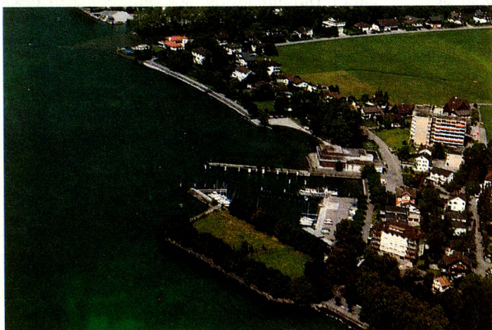
Arquitectos suizos del extranjero estarán encargados del arreglo de esta casi isla situada en la bahía de Brunnen.

(Fundación Plaza de los Suizos del Extranjero en Brunnen).