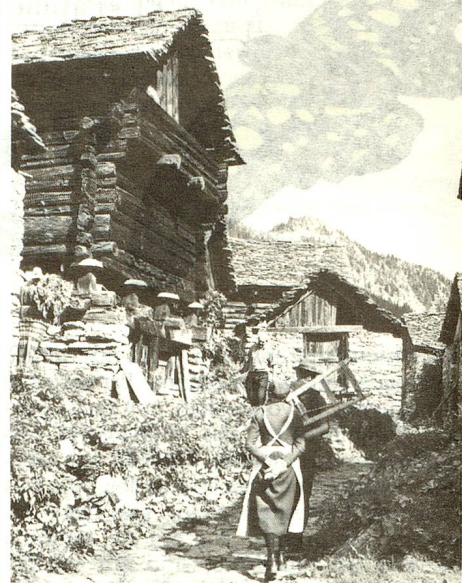
Desde el siglo XIII, hay Walser que viven en Bosco-Gurin, la única aldea germanófona del Tesino.

Las características de este pueblo migratorio, capaz de vivir en regiones de la alta montaña, lejos de todo, dió nacimiento a formas de vida y de alojamientos típicos. Obligados a subvenir por sí solos a sus necesidades, debían cultivar ellos mismos todo lo que les era necesario para vivir y almacenarlo para la larga temporada invernal. Para permitir esa vida de autosuficiencia había diseminados en el paisaje pequeños edificios: la casa habitación, la granja y el establo, el henil y el granero.