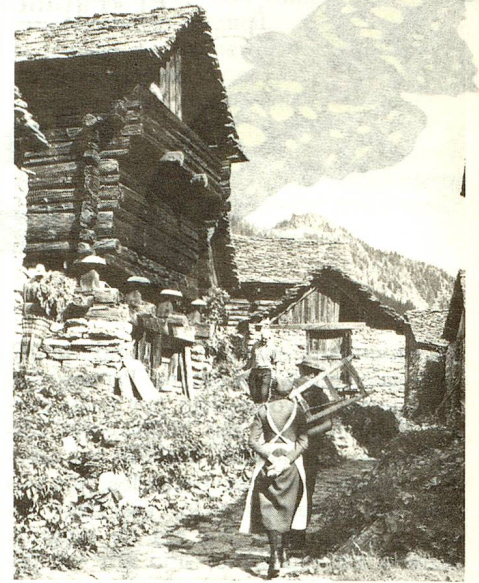
Desde el siglo XIII, hay Walser que viven en Bosco-Gurin, la única aldea germanófona del Tesino.

Las características de este pueblo migratorio, capaz de vivir en regiones de la alta montaña, lejos de todo, dió nacimiento a formas de vida y de alojamientos típicos. Obligados a subvenir por sí solos a sus necesidades, debían cultivar ellos mismos todo lo que les era necesario para vivir y almacenarlo para la larga temporada invernal. Para permitir esa vida de autosuficiencia había diseminados en el paisaje pequeños edificios: la casa habitación, la granja y el establo, el henil y el granero.