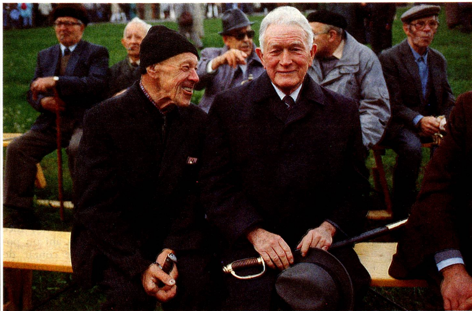
Por última vez entre ellos: los hombres de Rhodes-Extérieures en la landsgemeinde (con la espada como tarjeta de elector).

El semicantón de Appenzell-Rodhes-Extérieures acaba de tomar la decisión de acordar el derecho de voto a las mujeres. Es el penúltimo (semi) cantón y, a nuestro conocimiento, el penúltimo Estado del mundo en hacerlo. Luego de cuatro votos negativos, la landsgemeinde (compuesta de hombres) del 30 de abril de 1989 en Hundwil se pronunció final-