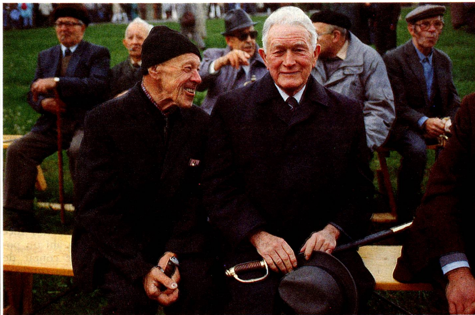
Por última vez entre ellos: los hombres de Rhodes-Extérieures en la landsgemeinde (con la espada como tarjeta de elector).

El semicantón de Appenzell-Rodhes-Extérieures acaba de tomar la decisión de acordar el derecho de voto a las mujeres. Es el penúltimo (semi) cantón y, a nuestro conocimiento, el penúltimo Estado del mundo en hacerlo. Luego de cuatro votos negativos, la landsgemeinde (compuesta de hombres) del 30 de abril de 1989 en Hundwil se pronunció final-