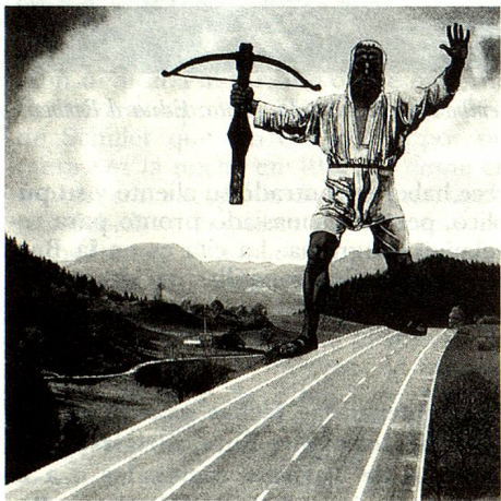
Guillermo Tell conduciendo un combate político «basta de asfalto»...

Tal como es bien sabido desde hace mucho tiempo, el fenómeno de nuestro héroe nacional no puede ser objeto de un enfoque puramente científico e histórico. En vez de preguntarnos si Tell es un personaje histórico, haríamos mejor considerando la historia de su influencia a través de los siglos así como su aspecto simbólico, psicológico, sociológico y mítico. Una obra de Uli Windisch y Florence Cornu,