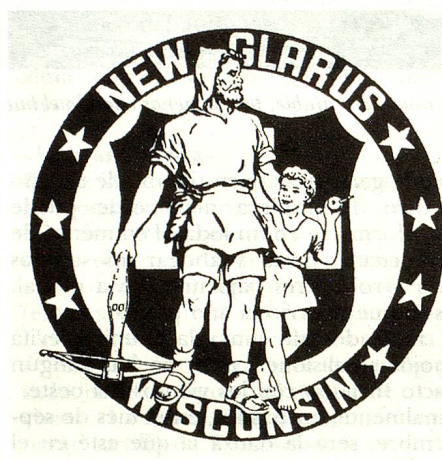
...dando la vuelta al mundo (colonia suiza de New Glarus en los Estados Unidos)...

recientemente publicada y titulada «Tell de todos los días», plantea el problema bajo una nueva luz. Es increíble lo que un profesor de sociología y una historiadora de arte han conseguido reunir en unos diez años de trabajo. Provocan sonrisas y movimientos de cabeza y, a veces, dejan pensativo.