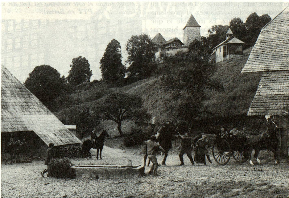
«La Araña negra» de Gotthelf, contra un fondo imponente.

Para obtener las fechas exactas de los espectáculos al aire libre, dirigirse a las Oficinas de Turismo regionales o a la Oficina Nacional Suiza del Turismo, Bellariastrasse 38, CH-8027 Zurich