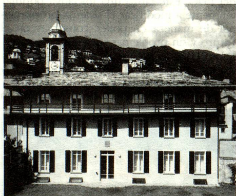
La Casa Rusca en Locarno alberga la colección de obras de arte de la ciudad de Locarno así como la colección Hans Arp.

¿Es que la imagen del cantón más meridional de Suiza estaría pues cambiando? Desde hace algunos años, intelectuales y autoridades tratan de restituir al Tesino una identidad que, para algunos, está ya perdida y, para otros, nunca existió. Más allá de esas divergencias de opinión una cosa es, en todo caso, cierta: existe la voluntad de cambiar esa imagen, lo que se manifiesta bajo diferentes formas. En el curso de los últimos cinco años esa voluntad de salir de cierto aislamiento cultural se distinguió ante todo por una gran actividad en la esfera de las exposiciones.