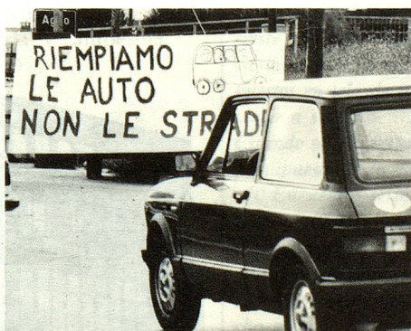
Protesta contra los ambulativos que vienen en automóvil, en el Malcantone: «Colmamos los automóviles y no las rutas».

dedor de 350.000 habitantes. Estas cifras muestran la profunda evolución de la organización territorial del cantón. El Tesino, una de las regiones más montañosas de Suiza, está hoy día entre las más urbanizadas —el 76% de la población reside en las cuatro aglomeraciones de Lugano.