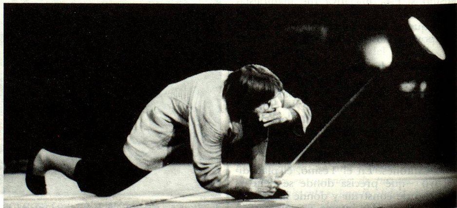
Es escena, el mismo Dimitri, célebre en el mundo entero.

En cambio, los «boccalini» pasaron un poco de moda. Hasta una época reciente eran uno de los símbolos del turismo, al que se trata actualmente de dar un nuevo