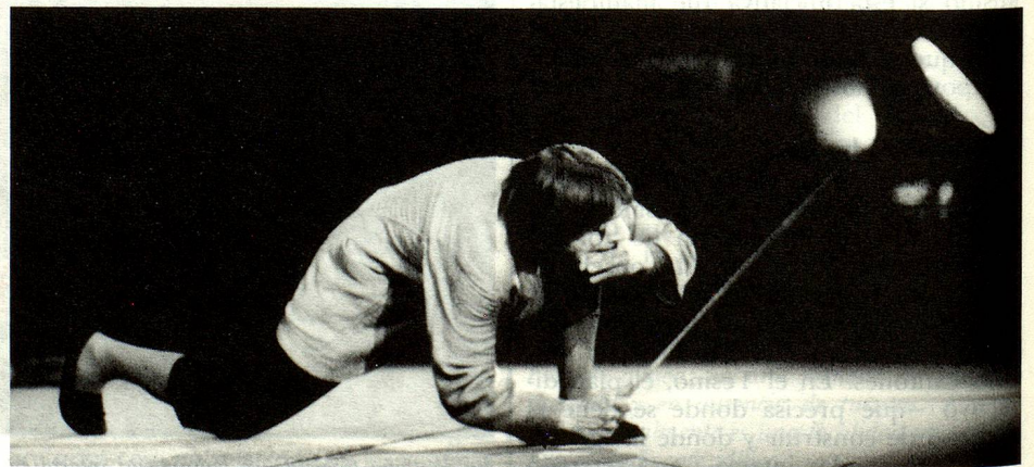
Es escena, el mismo Dimitri, célebre en el mundo entero.

Después de haber seguido una curva descendente en los años setenta, el Festival del Film volvió a ser un escenario interesante para los realizadores todavía poco conocidos y para los amantes del cine in-