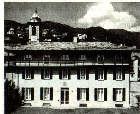
La Casa Rusca en Locarno alberga la colección de obras de arte de la ciudad de Locarno así como la colección Hans Arp.

¿Es que la imagen del cantón más meridional de Suiza estaría pues cambiando? Desde hace algunos años, intelectuales y autoridades tratan de restituir al Tesino una identidad que, para algunos, está ya perdida y, para otros, nunca existió. Más allá de esas divergencias de opinión una cosa es, en todo caso, cierta: existe la voluntad de cambiar esa imagen, lo que se manifiesta bajo diferentes formas. En el curso de los últimos cinco años esa voluntad de salir de cierto aislamiento cultural se distinguió ante todo por una gran actividad en la esfera de las exposiciones.