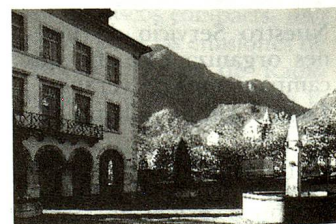
Vouvry (VS)

con la madre patria depende del sentimiento de sentirse bien en ella sobre la base del respeto y la consideración que cada uno tiene que recibir de parte de sus conciudadanos. La noción moderna de patria nos demuestra que sería completamente ilusorio querer arraigar alguien a su comuna