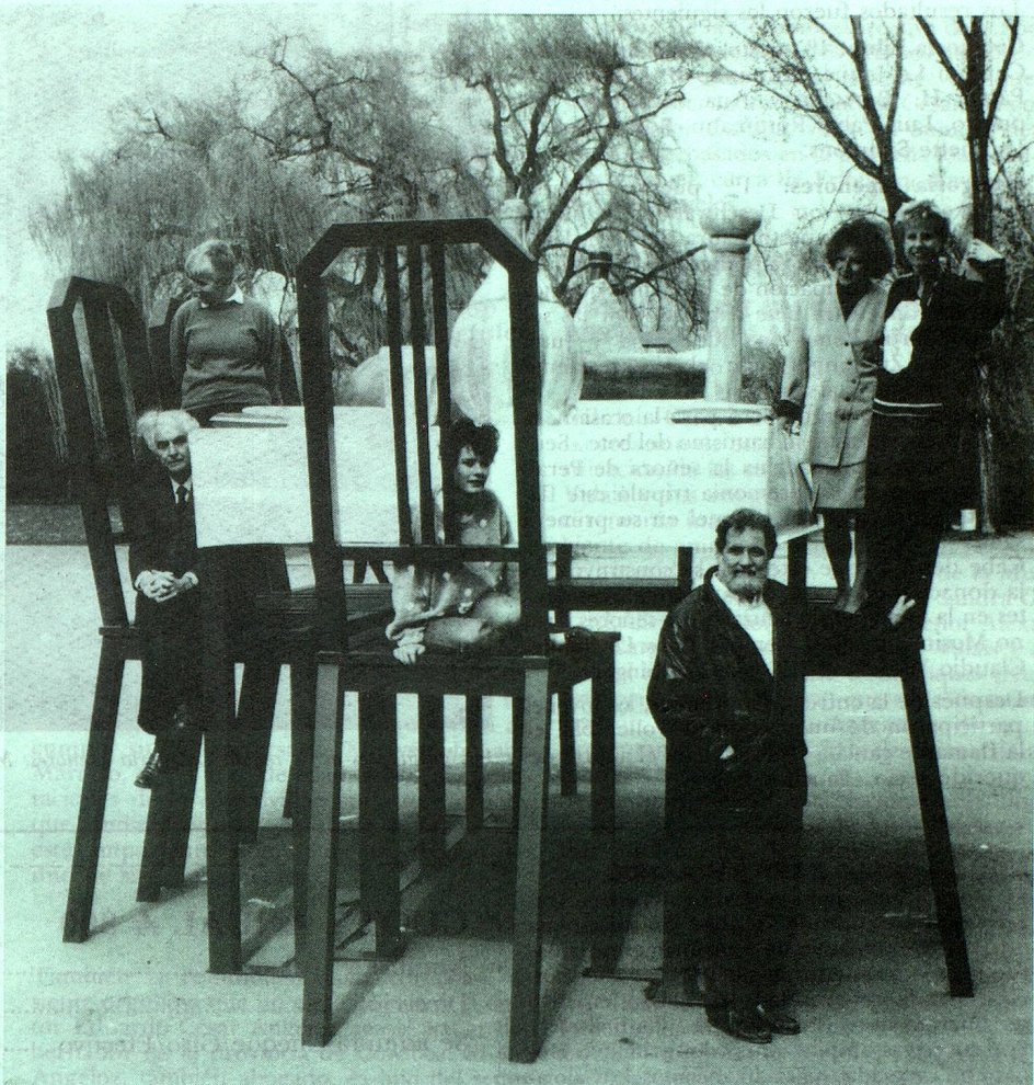
«La table d'hôte» - Una antigua costumbre que renace

El viernes 28 de abril inauguró una exposición en el Centro de Arte y Comunicación (CAYC), que superó todas las previsiones en cuanto a asistencia. Diversas personalidades, profesionales y estudiantes de arquitectura colmaron los salones del CAYC, impacientes por oír las palabras de Botta sobre sus obras y sobre la arquitectura en general. Fue tal la cantidad de público que, en determinado momento, se interrumpió el tráfico por la calle Viamonte y, mismo, el Embajador de Suiza Dr. Karl Fritsch, que iba a hablar en el acto inaugural de la muestra no pudo ingresar al CAYC.