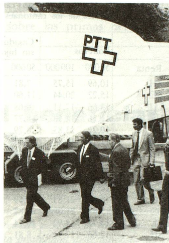
Los «oídos» del mundo: El Consejero Federal Ogi (al medio) delante la estación móvil de recepción de satélite en Naefels.