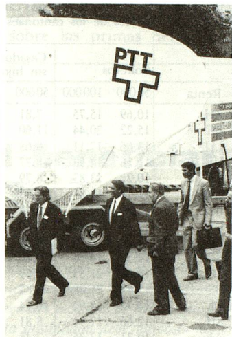
Los «oídos» del mundo: El Consejero Federal Ogi (al medio) delante la estación móvil de recepción de satélite en Naefels.