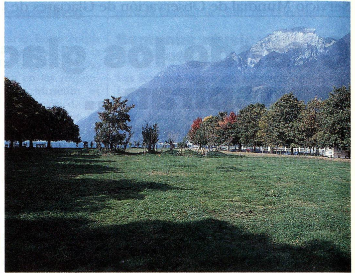
Plaza de los Suizos del Extranjero en Brunnen: Lugar de encuentros y meditación.

última etapa con entusiasmo y determinación.