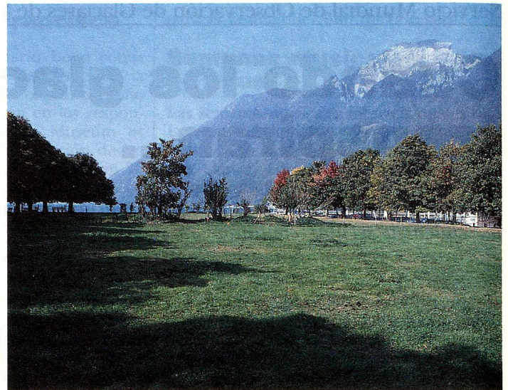
Plaza de los Suizos del Extranjero en Brunnen: Lugar de encuentros y meditación.

Nuestro proyecto encuentra un interés creciente en Suiza. El 5 de octubre de 1988 el Consejo Nacional transmitió el siguiente postulado: «Se invita al Consejo Federal a examinar en qué forma y en qué medida la Confederación podría participar en los gastos ocasionados por el proyecto 'Plaza de los Suizos del Extranjero' en Brunnen». Un estímulo más para acometer la