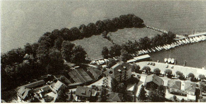
Plaza de los suizos del extranjero