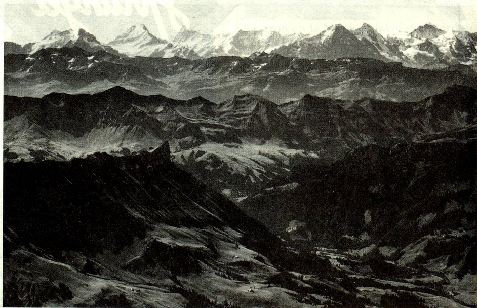
Las montañas suizas: una mayor atracción para el público. Esta vista aérea muestra las cadenas de montañas de los Prealpes y de los Alpes berneses. Arriba a la derecha, se ve el Eiger, el Mönch y el Jungfrau.

Gracias a ellos, la región del Gothard se volvió rica pero dependiente. En Suiza, una persona en actividad sobre diez vive del turismo; en las regiones de montaña, que representan por cierto las dos terceras partes de nuestro país, hay mismo