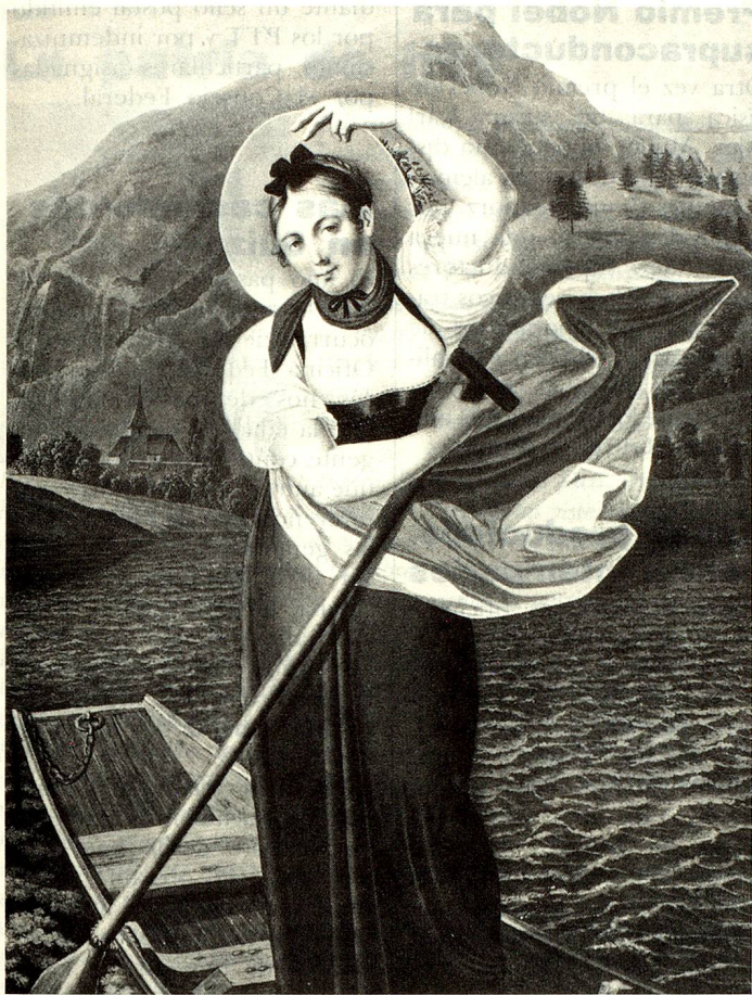
Las «lindas barque- ras» – atracción tu- rística del siglo XIX– eran jóvenes que, remando y can- tando, atravesaban el Lago de Brienz para conducir a los turis- tas a las cascadas del Giessbach.

una sobre tres. Desde St. Moritz hasta Montreux, la cuarta parte de los ingresos provienen del turismo.