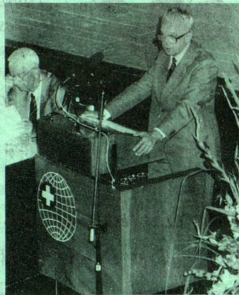
El Consejero Federal León Schlumpf, que se retira a fin de año, se dirige a los suizos del extranjero.

El tema dominante de toda la asamblea plenaria fue el sistema de seguridad social y de seguro contra enfermedad vigente en Suiza, y diversos conferencistas, altamente calificados, informaron al auditorio sobre el mismo. Los participantes adoptaron una resolución sobre puntos precisos (ver recuadro) pero fueron también testigos de una iniciativa concreta e importante desde el punto de vista social: el Fondo de Solidaridad de los Suizos del Extranjero y la Sociedad suiza Grütli firmaron un convenio que ofrece a los suizos del extranjero la posibilidad de adherirse, mediante el pago de una prima medianamente modesta, a un seguro riesgo que les permitirá, al regresar a Suiza, ser admitidos sin ninguna reserva en la caja de seguro contra enfermedad (ver editorial, página 3, así como el anuncio página 10). Otro punto importante de la asamblea plenaria fue, para todos los participantes, el discurso reboante de espíritu y de ideas del Consejero Federal León Schlumpf, que se retira a fin de año: dio la bienvenida a los presentes en las cuatro lenguas nacionales.