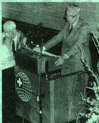
El Consejero Federal León Schlumpf, que se retira a fin de año, se dirige a los suizos del extranjero.

El tema dominante de toda la asamblea plenaria fue el sistema de seguridad social y de seguro contra enfermedad vigente en Suiza, y diversos conferencistas, altamente calificados, informaron al auditorio sobre el mismo. Los participantes adoptaron una resolución sobre puntos precisos (ver recuadro) pero fueron también testigos de una iniciativa concreta e importante desde el punto de vista social: el Fondo de Solidaridad de los Suizos del Extranjero y la Sociedad suiza Grütli firmaron un convenio que ofrece a los suizos del extranjero la posibilidad de adherirse, mediante el pago de una prima medianamente modesta, a un seguro-riesgo que les permitirá, al regresar a Suiza, ser admitidos sin ninguna reserva en la caja de seguro contra enfermedad (ver editorial, página 3, así como el anuncio página 10). Otro punto importante de la asamblea plenaria fue, para todos los participantes, el discurso rebotante de espíritu y de ideas del Consejero Federal León Schlumpf, que se retira a fin de año: dio la bienvenida a los presentes en las cuatro lenguas nacionales.