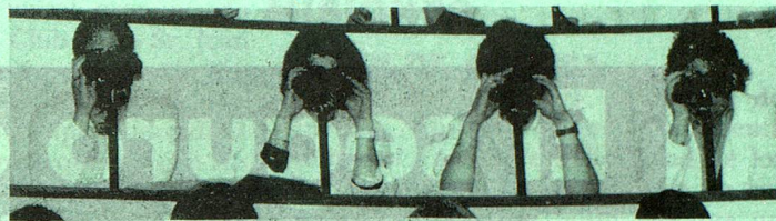
No solamente los futuros médicos deberían mirar de más cerca... (Estudiantes en el anfiteatro de patología de la Universidad de Berna).

Escuelas privadas en Suiza , lista de escuelas que forman