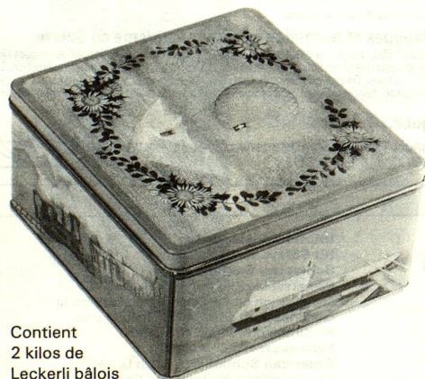
Contient 2 kilos de Leckerli bâlois

Dans les prix indiqués, tout est compris, soit les frais de port, l'emballage et l'assurance. Pour le paiement, veuillez joindre à la commande un chèque encaissable en Suisse ou effectuer le versement par poste, banque, ou solliciter vos amis helvétiques. Nous nous réjouissons de pouvoir vous adresser très bientôt un cordial bonjour de Bâle.