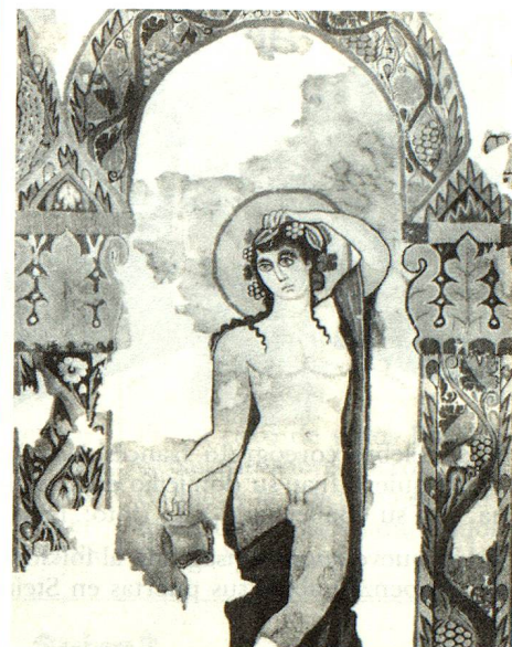
El dios del vino, personaje central del tapiz de Dionisio.

El análisis del estado de conservación y de la alteración de los colores permitió reconstituir íntegramente una de las más hermosas tapicerías de la época greco-romana. Esta representa una procesión dionisiaca, compuesta de ocho personajes