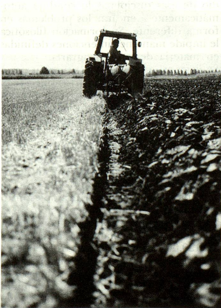
Agricultor de la planicie trabajando.

Los países en desarrollo, hacia los cuales desea exportar maquinarias, a menudo pueden sólo procurarse las divisas necesarias vendiendo productos agrícolas. En Suiza, los países en desarrollo tropiezan frecuentemente con fronteras cerradas. Suiza ha erigido, sin duda como ningún otro país, barreras para proteger su agricultura. En el Acuerdo General sobre las Tarifas Aduaneras y el Comercio (GATT), solicitó diversas derogaciones a las reglas establecidas. Es este proteccionismo agrícola —que obstaculiza la industria de exportación— que Fritz Leutwiler ha criticado. Por otra parte, este punto de vista coincide con los intereses de grandes comercios de distribución y asociaciones de consumidores, que critican el proteccionismo agrícola reivindicando el derecho de cada uno de dirigir su propia vida. Por ejemplo no es muy grato ver que especialidades de quesos extranjeros sean encarecidos en la frontera, que la importación de vinos esté sometida a contingentes y que la Unión Suiza de Campesinos haya recientemente solicitado que se frene la importación de productos de caza, de aves y de pescados