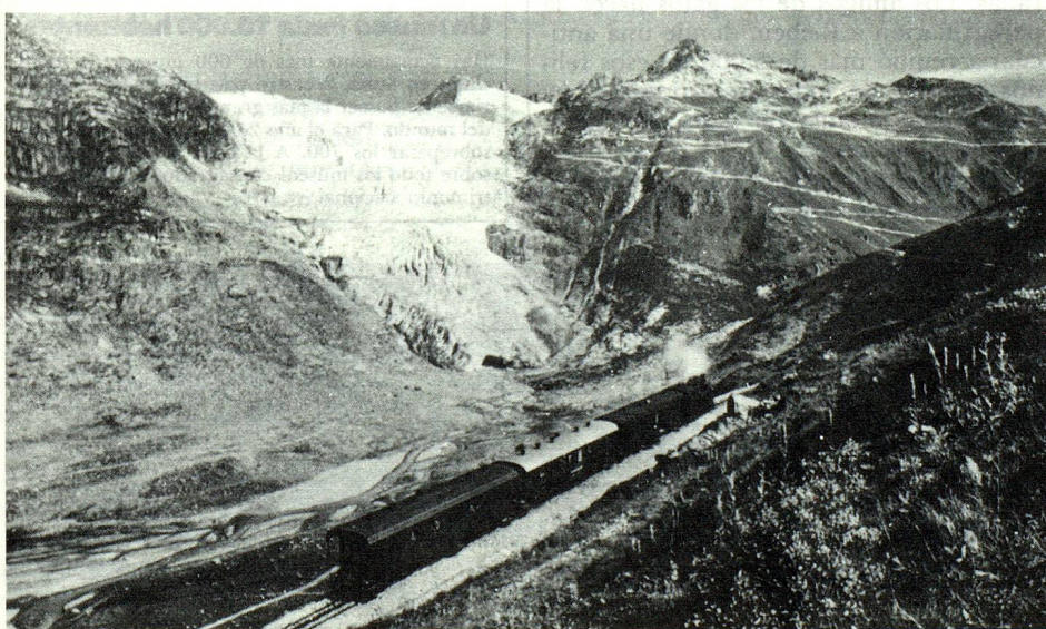
Foto histórica tomada delante del glaciar del Ródano, sobre la línea de la Furka, actualmente desahogada.