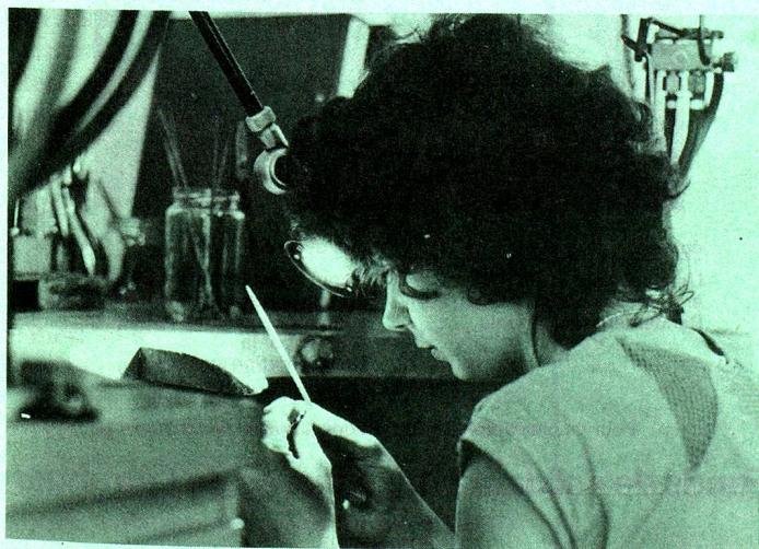
Aprendiz de Orfebre.

Las condiciones de admisión son muy diversas. En algunos casos no se exige más que un buen certificado suizo de fin de escolaridad obligatoria o una experiencia profesional previa, mientras que en otros hay que haber terminado un aprendizaje o aprobado un examen de bachillerato. A veces, los certificados extranjeros de fin de escolaridad son reconocidos, siempre que sean comparables a los obtenidos en Suiza.