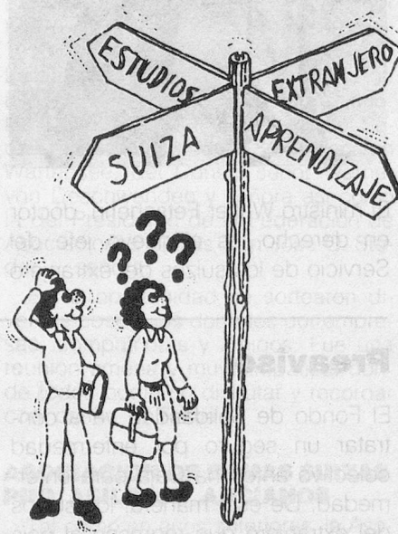
Extraído de la Guía de Elección Profesional. Editor: Reinhard Schmid CH-8185 Winkel.

Una formación en Suiza: un deseo y un ideal para muchos jóvenes. Pero ideal y realidad no siempre coinciden. Las ideas que se hacen algunos jóvenes suizos del extranjero, así como sus padres, sobre Suiza, su sistema de formación y su mundo de trabajo, están a menudo muy alejadas de la realidad actual de nuestro país. Quien no quiere vivir experiencias penosas debería informarse de manera muy precisa: los interesados y sus padres deberían ponerse en contacto con los centros suizos de información, más especialmente con la Asociación para