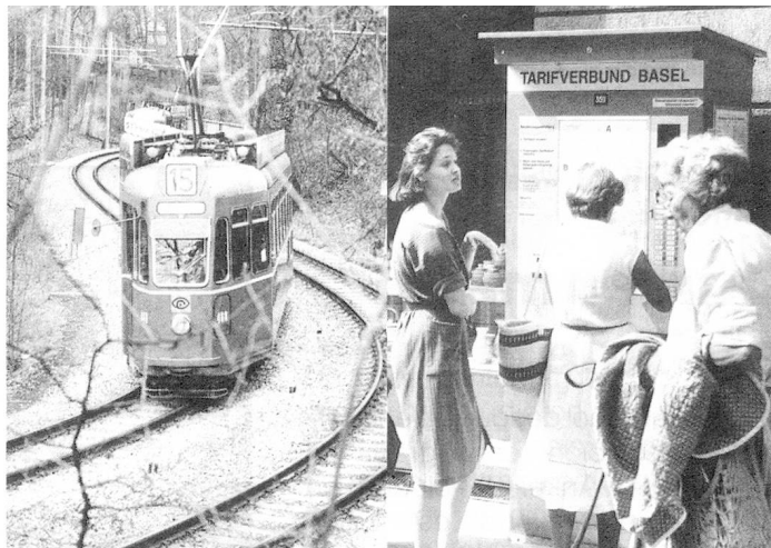
Comunidad tarifaria en Basilea: frente al tranvía, afluencia delante del expendededor automático de boletos.

Pero la idea ha anidado en otras ciudades suizas. Berna, Lucerna, Olten, Saint-Gallen, Soleure y Zurich, han puesto en circulación el