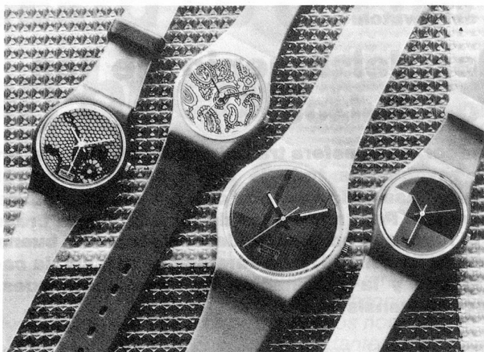
La colección Swatch otoño/invierno 1985-86