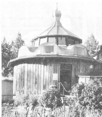
El Taller Segantini

Una de las obras más importantes de Giovanni Segantini (1858-1899) es el tríptico «La vida, la naturaleza y la muerte». Adquirida por la Fundación Gottfried Keller, de Zurich, se encuentra, desde 1908, en el Museo Segantini en Saint Moritz. Este tríptico fue un pedido hecho a Segantini para la Exposición Universal de 1900 en París. Con esta «sinfonía alpina, fiel reproducción de la naturaleza», ubicada en el Pabellón suizo, se esperaba promover el turismo naciente en la Alta Engadina. Pero razones financieras impidieron que ese ambicioso proyecto se realizara.