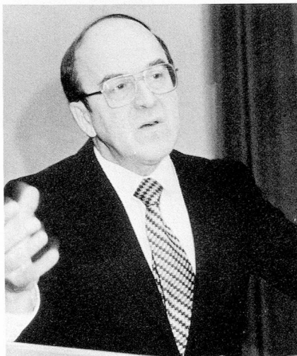
Nuestro huésped de honor, señor Kurt Furgler

El marco era también original ya que fue en la MUBA, feria muy conocida por nuestros compatriotas del extranjero —menos atrayente quizás que un típico pueblo suizo pero igualmente de gran interés por las posibilidades que ofrece de descubrir nuestro país bajo otro aspecto— que tuvo lugar nuestro encuentro anual.