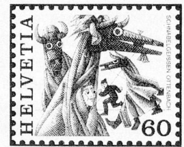
Schnabelgeissen, Ottenbach ZH