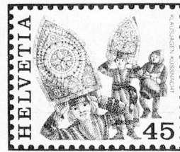
Klausjagen, Küssnacht a. R. SZ