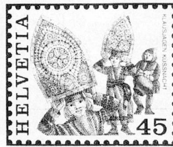
Küssnacht, Küssnacht a. R. SZ