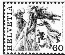
Schnabelgeissen, Ottenbach ZH