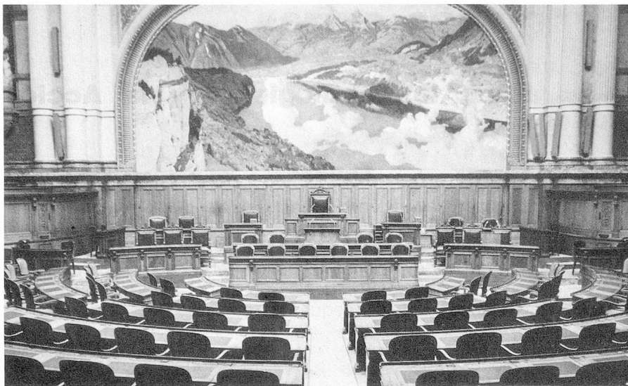
Sala del Consejo Nacional

estuvo tentado de hacer grupo común con la Alianza de los Independientes). Todos pertenecen al ala moderada del movimiento ecológico. Pueden entenderse entre sí. El verdadero vencedor de estas elecciones federales es el Partido Radical Suizo, es decir, la derecha. Registra una ganancia adicional de tres asientos en el Consejo de Estados y otros tantos en el Consejo Nacional. En la Suiza Romanda los radicales obtuvieron resultados brillantes. En Ginebra conquistaron con Robert Ducret el mandato del socialista Willi Donzé. En el Cantón de Vaud aumentó su delegación al Consejo Nacional, de cinco a siete. En el Jura son aún más fuertes y se ubican ahora en dos de los cuatro asientos del nuevo Cantón, en las Cámaras Federales: Gastón Brahier en el Consejo de Estados y Pierre Etique en el Consejo Nacional. Este es, por cierto, uno de los más grandes éxitos del 23 de octubre.