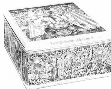
Contenido 2 kilos de Basler Leckerli

Precio: En países limítrofes con Suiza: Fr. 55,50; en el resto de Europa: Fr. 57,50; USA: Fr. 63; demás países: Fr. 61,50 (incluido porte y seguro, vía terrestre o marítima).