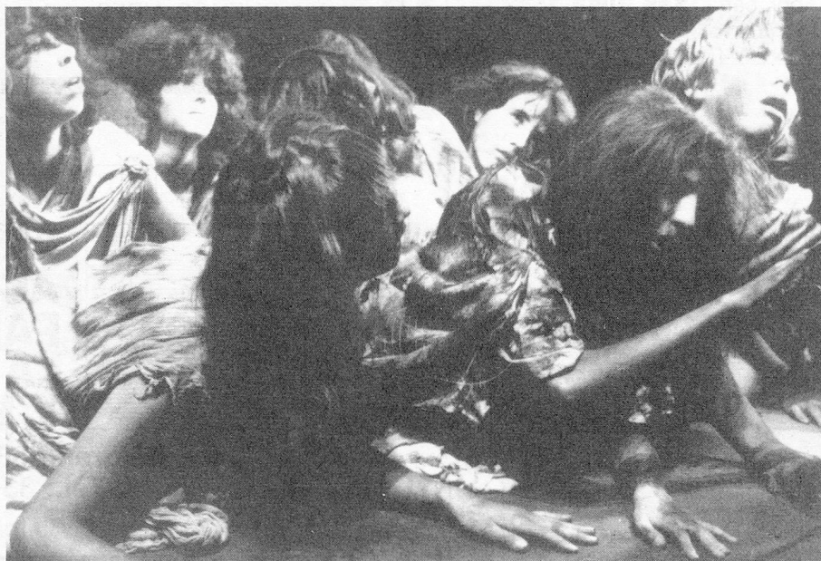
Una escena del filme «Mutación».