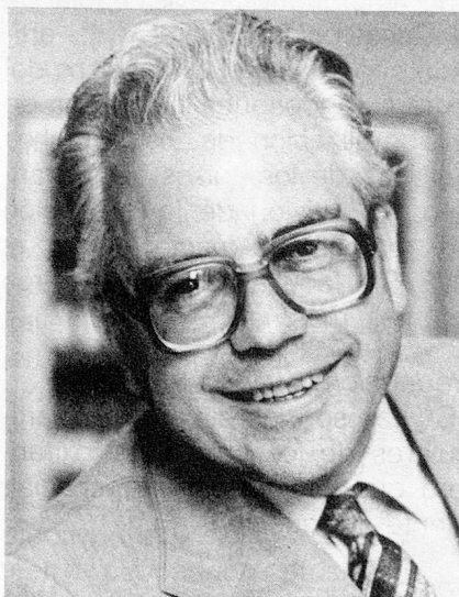
El Canciller Federal Walter Buser

La Cancillería Federal constituye el estado mayor del Consejo Federal, el órgano central que coordina su trabajo y prepara sus sesiones. Asiste al presidente de la Confederación en la dirección de los asuntos gubernamentales.