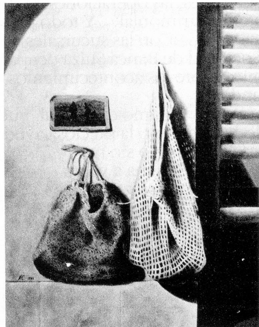
Norbert Clément «Angelus» (Perú)