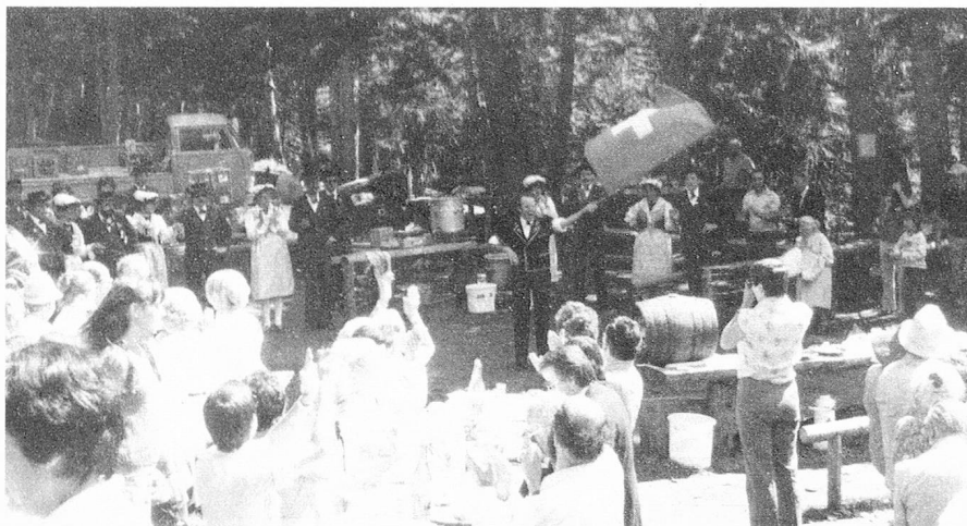
Un grupo folklórico anima la excursión del domingo.

La Comisión, finalmente, juzga importante y urgente, que la solución a que se aspira, sea adaptada ya ahora a la revisión que se encuentra en marcha, del derecho de nacionalidad.