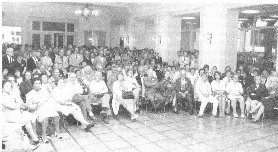
En la apertura oficial del Congreso.