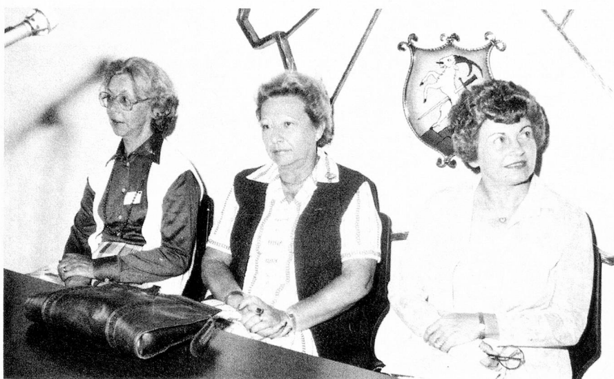
De izq. a der.: Sra. Walz, Sra. Adatte y Sra. Monney

Debido a que llovía torrencialmente, la inauguración oficial del Congreso no pudo realizarse al aire libre, como estaba programado, debiéndose trasladar la misma a la sala del Municipio. La tristeza que por tal motivo amenazaba brotar, fue prontamente disipada por las excelentes y bien logradas representaciones de un grupo de cantores folklóricos valaisanos en sus trajes típicos. Mientras el presidente de la ciu-