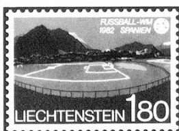
Sellos especiales «Campeonato mundial de football 1982 España»