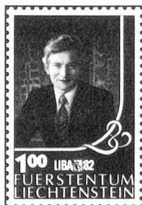
Sellos especiales «LIBA '82»