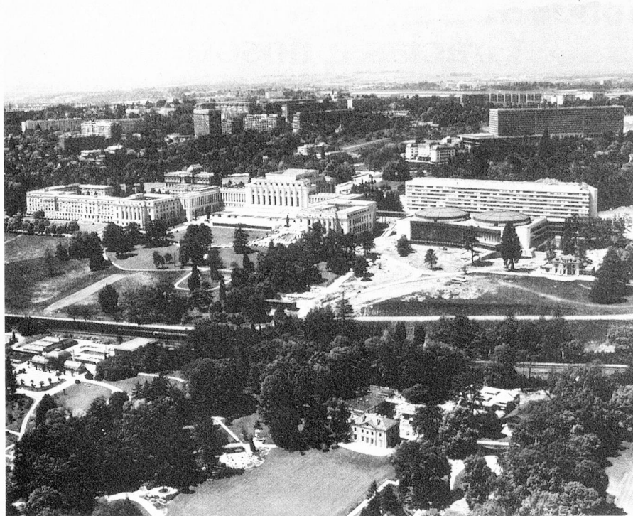
Sede de la ONU en Ginebra

pación en un número restringido de facetas elegidas si queremos realizar un trabajo eficaz a largo plazo. Es necesario tomar parte de una forma continua en los trabajos de las Naciones Unidas con el fin de poder seguir los problemas de principio a fin. También debemos estar en condiciones de reafirmar nuestros puntos de vista y de hacer progresar los conceptos a los que estamos arraigados. Es así que con nuestra ausencia voluntaria de la ONU nos arriesgamos a un aislamiento que solamente puede llegar a perjudicarnos. La razón nos recomienda por lo tanto participar activamente en la cooperación política, económica y social que se está desarrollando en el seno de la ONU. Podemos así poner fin a los inconvenientes resultantes del hecho que nuestra participación esté limitada en varios aspectos. Tendremos la posibilidad de defender mejor nuestros intereses y de presentar directamente nuestra política a la comunidad de los Estados. Esto cobra aún mayor importancia tomando en cuenta que una parti-