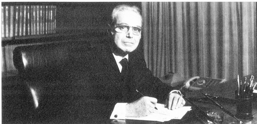
Javier Pérez de Cuéllar, Secretario General de la ONU

17 de Noviembre de 1971 Informe del Consejo federal sobre las relaciones de Suiza con la ONU y sus instituciones especializadas en los años 1969 a 1971 (segundo informe ONU). Las conclusiones hacen resaltar que el nivel de la evolución de la ONU hacia la universalidad es un elemento importante para apreciar nuestras relaciones con las Naciones Unidas y, en este contexto, para nuestra política de neutrali-