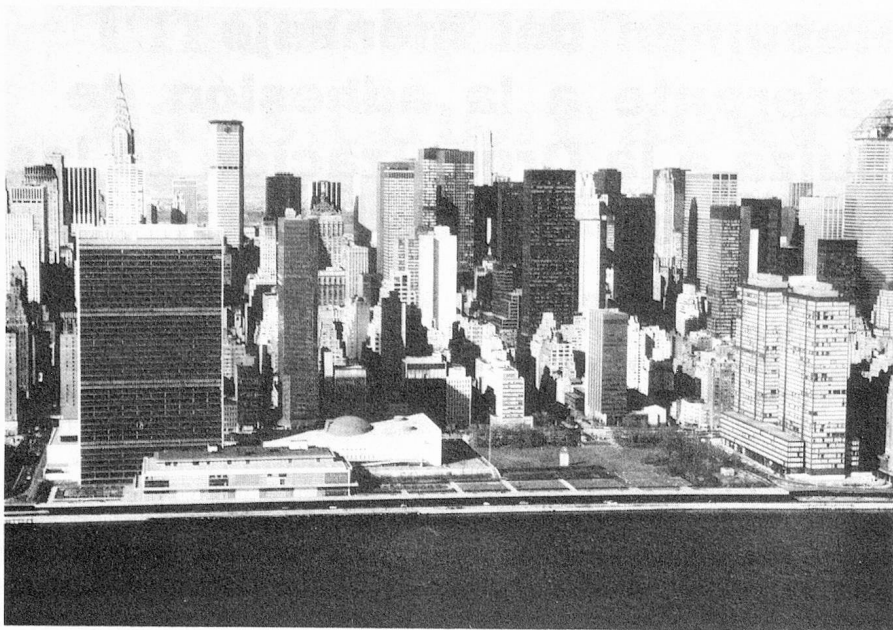
Edificio de la ONU en Nueva York

la índole de los conflictos lo que condujo a que la ONU concebiera nuevos métodos para mantener la paz tales como el envío de misiones de mediación y de observación y contingentes de cascos azules. La ONU creó así, sobre una base voluntaria, un instrumento capaz de crear las condiciones previas a una solución pacífica o de contribuir a la búsqueda de tal solución.