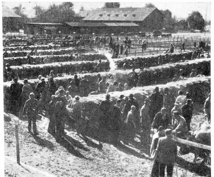
Feria de ganado en Will

avalancha y complejidad de nuevas leyes hacen cada vez más difícil su tratamiento en esta forma, lo que conduce a la oligarquía de una clase dirigente que domina al parlamento central. Tendrá que evitarse asimismo que la Landsgemeinde descienda a nivel de una mera manifestación folklórica. Y aquí hace falta educar, lo que no se descuida. La escuela primaria tiene un ciclo de 9 años de enseñanza. No faltan los modernos edificios escolares. El gimnasio de los Padres Capuchinos en Stans está abierto a varones y mujeres, equivaliendo su enseñanza a la de una escuela secundaria. Para la formación superior se han concertado concordatos con establecimientos educacionales extra-cantoniales, que aseguran a los ansiosos por estudiar suficientes posibilidades de formación en diferentes especializaciones. Solamente aquellos estudiantes de institutos superiores que por contar con becas mínimas, se ven obligados a buscar ingresos adicionales, son los que están en condiciones más desventajosas. En el campo económico se pro-