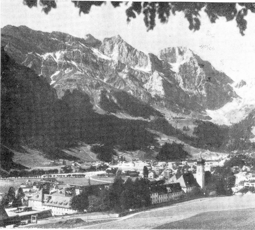
Convento benedictino en Engelberg fundado en 1120