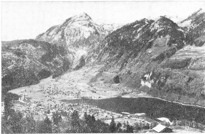
Lungern junto al lago del mismo nombre