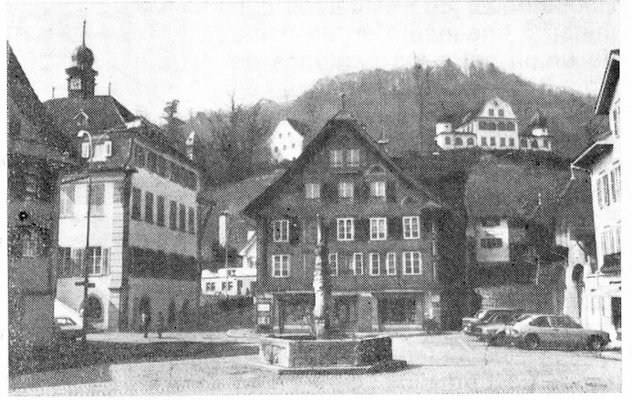
Parte antigua de Sarnen; a la izquierda el palacio municipal; sobre la colina de Landenberg el viejo stand de tiro

ánimos exaltados de los diputados de la Dieta y facilitar el ingreso de Friburgo y de Solothurn a la Confederación, un acontecimiento que será debidamente celebrado el año venidero. Pero si la cólera del pueblo se inflama, entonces la reacción del pueblo es tremenda. La constitución cantonal, aprobada