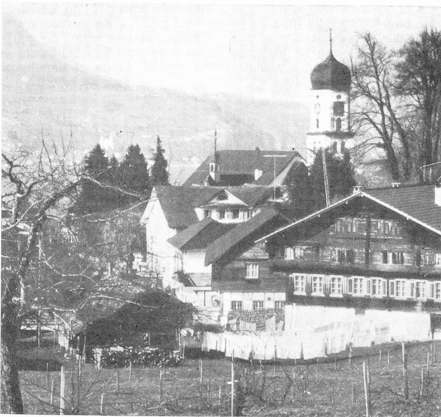
Vista de Sachseln a orillas del lago Sarnen

sos. La biblioteca del Convento de Einsiedeln alberga una gran cantidad de libros ricamente iluminados a mano, del siglo 12, así como una importante colección de obras de arte de la edad media. Entre los cultores modernos del arte literario debe mencionarse ante todo a Heinrich Federer (1866-1928), quien supo expresar las impresiones de su juventud vivida en Sachseln y reflejar poéticamente la imagen del magnífico paisaje de los alrededores del lago de Sarnen, produciendo una obra que retrata en cálido y conmovedor estilo a los hombres y a la tierra de la comarca. En el plano musical el "Jodel" y el "Betruf" (llamado religioso lanzado de una montaña a otra) están presentes desde tiempos inmemoriales. Se cultiva asimismo asiduamente la música folklórica. Numerosos escritores, compositores de música popular y moderna, pintores y escultores, adquirieron un renombre que traspasó las fronteras de nuestro país. Esta escultura típica debe ser cuidada a igual que el paisaje, pues ambos están enraizados entre sí. Se procura proteger y enriquecer el paisaje mediante una cuidadosa división de las zonas de edificación, de praderas y bosques. Y como un primer intento para enriquecer la fauna del cantón se ha procedido a la reintroducción del lince.