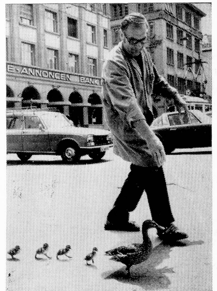
Deseamos que todos nuestros lectores hayan pasado sin contratarnos al nuevo año 1979, tal como esta familia de patos en las riberas del Limmat.