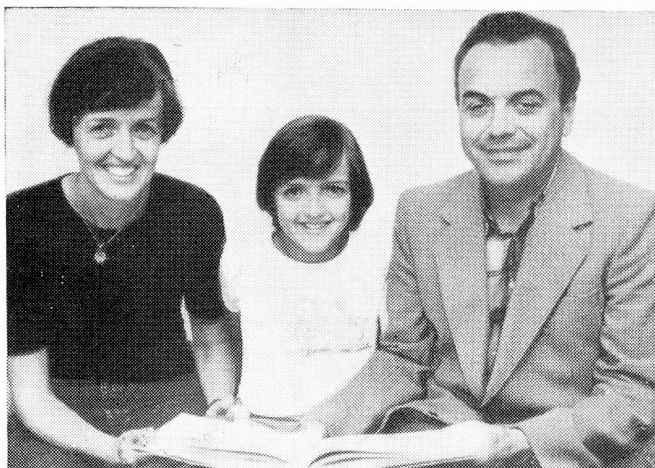
El profesor e investigador basileño Werner Arber obtiene el premio Nobel en Medicina. Aquí con su esposa e hija.