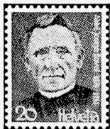
Abbé Joseph Bovet 1879-1951 Komponist Compositeur Musicista

Ausgabetag Jour d'émission 14 9 1978 Giorno d'emissione