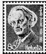
Auguste Piccard 1884-1962 Physiker Physicien Fisico