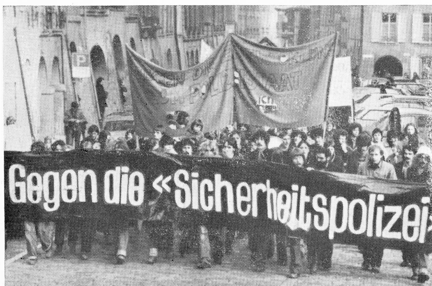
Muchas opiniones divergentes provocó la votación sobre una policía de seguridad. El pueblo rechazó el proyecto.