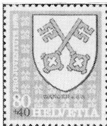
Wangen a. d. A. (BE)