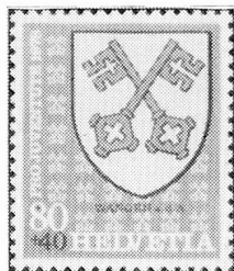
Wangen a. d. A. (BE)