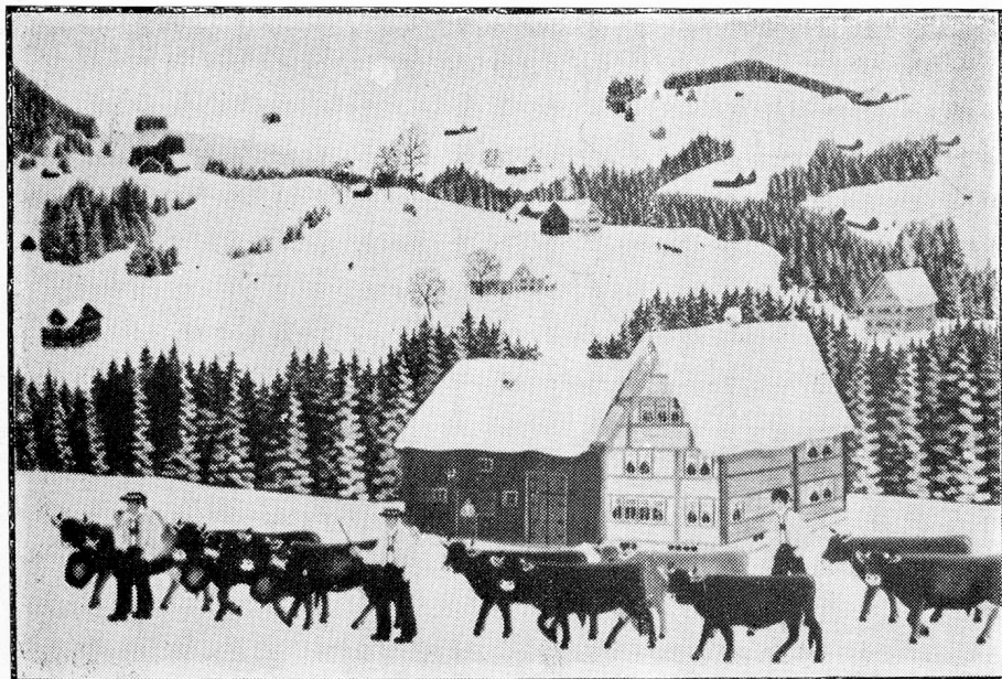
Paisaje invernal en Appenzell

cional de los campesinos. Esta tradición se ha conservado hasta el día de hoy y ni siquiera en sus temas ha cambiado nada. La renovada popularidad de que goza esta pintura también entre los jóvenes hay que buscarla particularmente en su vigor de expresión y en la técnica pictórica que impone al artista. Tal como ocurre con la pintura ingenua, el espectador ve claramente lo que el pintor quiso mostrar. Es el amor al detalle y a la terminación, lo que imparte a estas imágenes el sello de una irradiación a la vez encantadora y romántica. El proverbial punto sobre la "i" es el alfa y omega de esa pintura campesina.