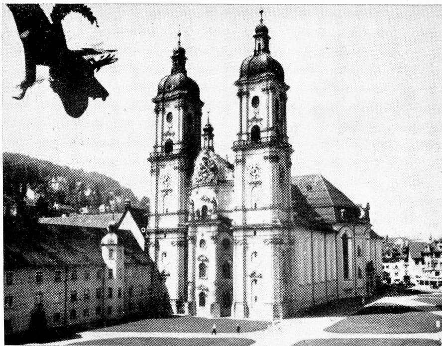
La Catedral de St. Gall, de estilo barroco

Desde su feudo, la célebre abadía benedictina, él reinaba como soberano absoluto sobre su "País de príncipe" situado entre las ciudades de Rorschach y Wil, mientras que el Toggenburg del siglo 18 más bien podía considerarse como una monarquía de tipo constitucional. Sola y totalmente cercada por el dominio abacial, la ciudad imperial de St. Gall era una república enana aunque libre, que mantenía rela-