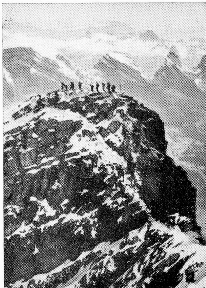
Vista desde el Sántis al Toggenburg y los Churfürsten

sobrenombre: el de "cantón del destino", ya que se trataba de saber si Suiza debía seguir siendo una federación de Estados o convertirse en un Estado federal. Once cantones estaban a favor de la nueva solución, pero se necesitaba la mayoría simple de 22 Estados para decidir. "Douze voix font la loi" declararon los cantones latinos. Con suspenso se esperó en Suiza, así como en el extranjero, el resultado de las nuevas elecciones en el "cantón del destino". Una mayoría ínfima se pronuncia en favor de los liberales, que, con sus aliados de iguales ideas, de los demás cantones suizos, están dispuestos a liquidar, si es preciso con las armas en la mano, al "Sonderbund" adherido al pasado, lo que efectivamente sucedió luego en el conflicto de 1847, conocido como guerra del Sonderbund. Con el Estado federativo de 1848 el cantón de St. Gall colabora adecuadamente. Hasta el presente cinco de nuestros Consejeros federales han salido del cantón (W. Naef, A. Hoffmann, K. Kobelt, Th. Holenstein y K. Furgler). Con satisfacción el cantón aceptó la ayuda federal para las construcciones de canalización