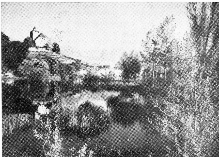
Castillo Werdenberg

A la existencia del ganado lechero de raza parda, se han ido agregando en los últimos años animales de otras razas. En materia de quesos el "Appenzeller" ha iniciado una marcha triunfal. Referente a la fauna salvaje le cabe a St. Gall un mérito especial. En efecto, gracias a los esfuerzos del Jardín Zoológico "Peter und Paul", se ha logrado re-introducir durante los últimos decenios el hirco en los Alpes después que había desaparecido. Las regiones protegidas como la del "Murgsee" donde prosperan los pinos de los Alpes y los marjales de turba, aseguran la supervivencia de especies de plantas raras. Como particularidad debe mencionarse que al abrigo de la cadena montañosa de los Churfürsten, junto al Walensee, en Quinten hasta los higos maduran regularmente. La riqueza del subsuelo de St. Gall es pobre. La mina de hierro de