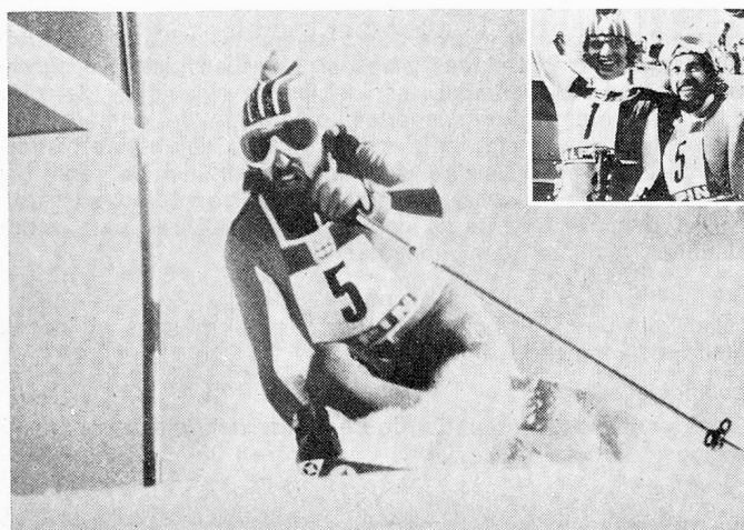
Extraordinarios resultados en slalom gigante: Heini Hemmi y Ernst Good conquistan respectivamente la medalla de oro y de plata.